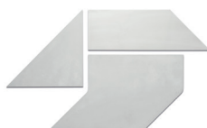
Plantillas de corte