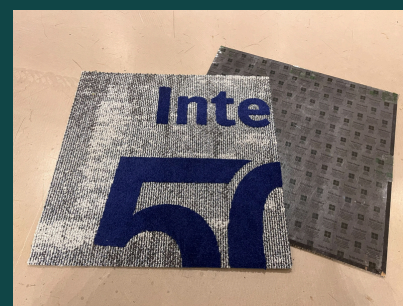
Motivform mit Aussparung