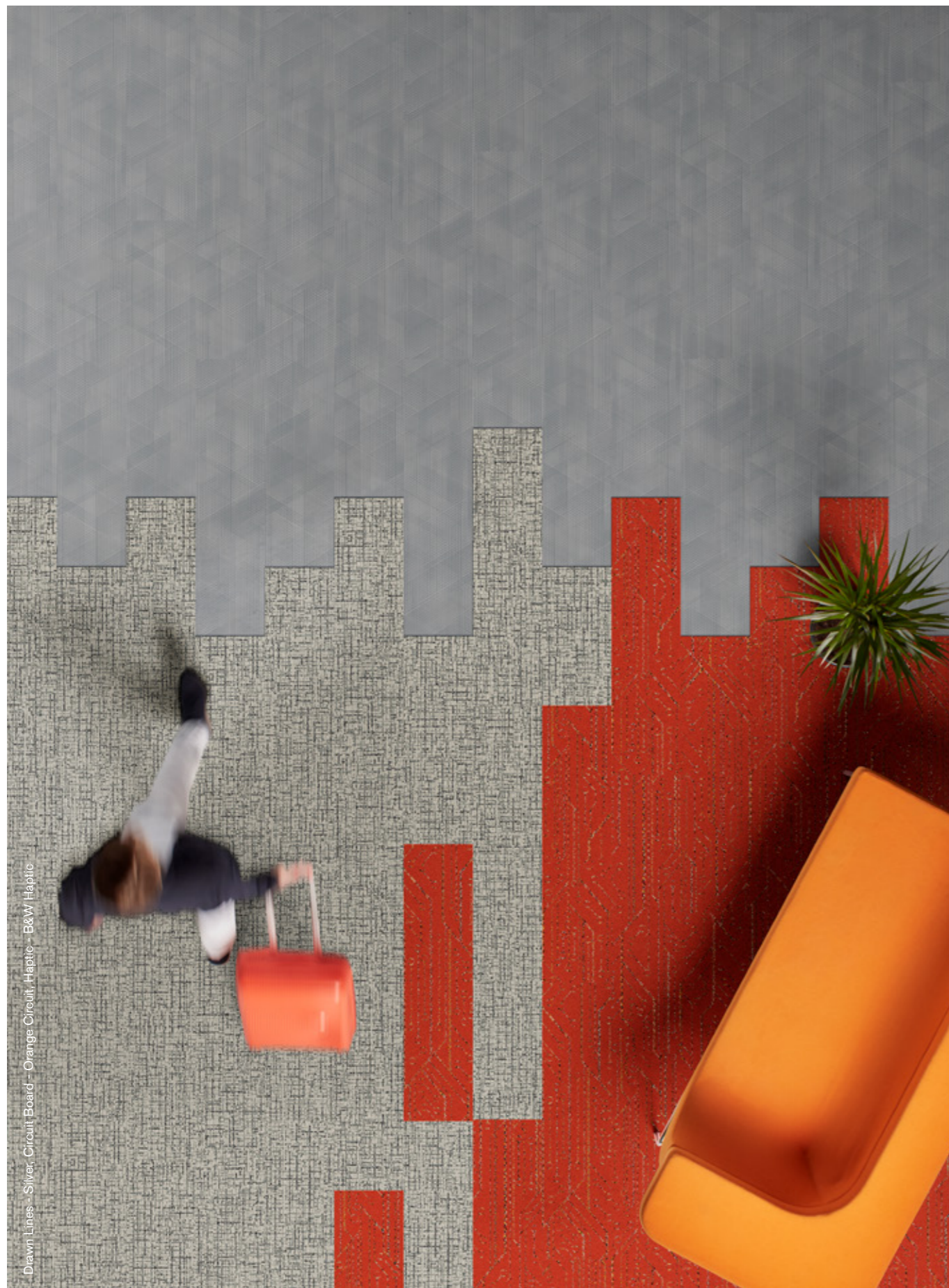
Drawn Lines - Silver, Circuit Board - Orange, Circuit, Haptic - B&W Haptic