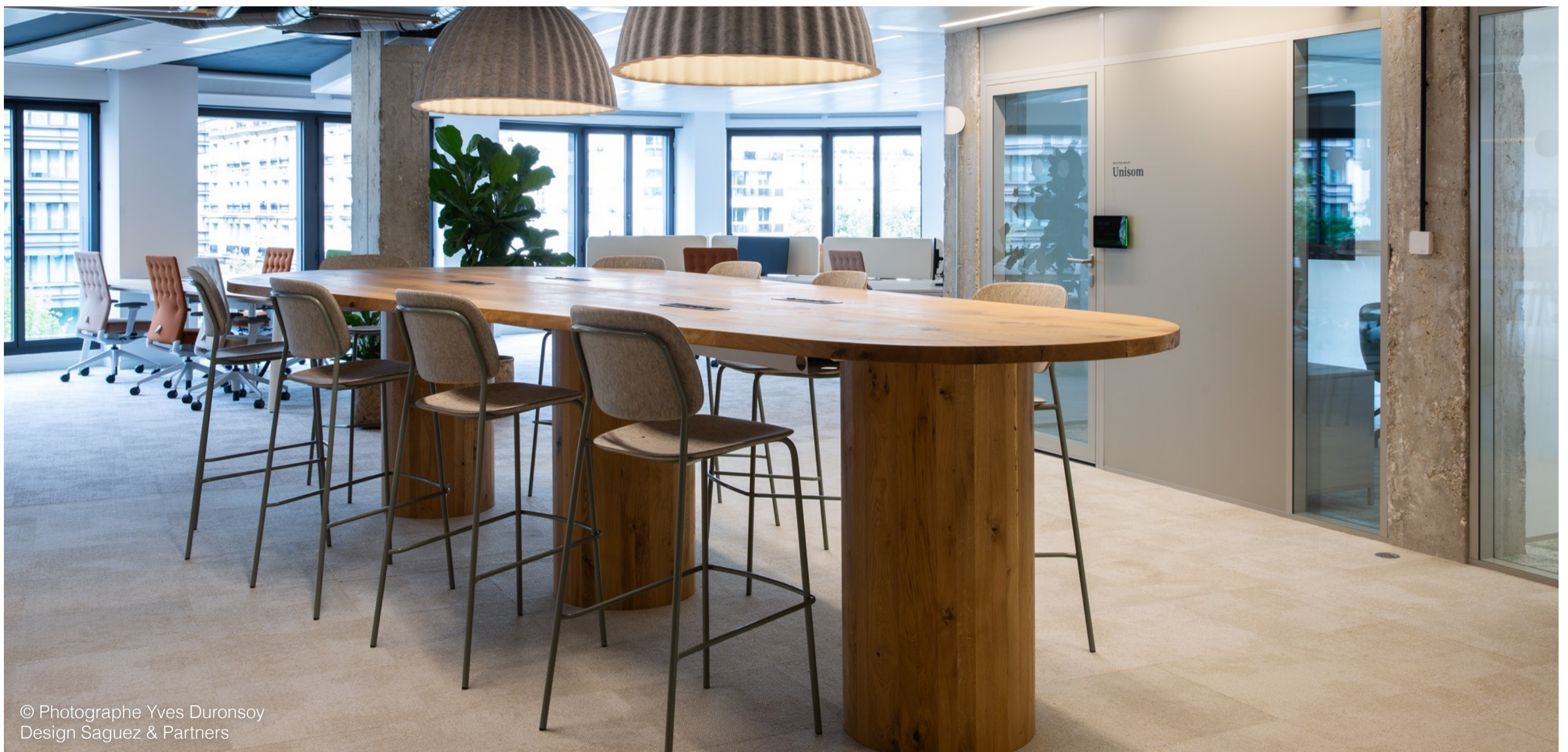
Design Saguez & Partners

Ce projet, porté par Sanofi et ORAK, illustre l'engagement total d'Interface pour faire émerger un modèle circulaire avec son programme de recyclage et de réemploi ReEntry® , où la fin de vie d'un produit marque le début d'un autre. L'économie circulaire n'est plus une promesse : elle prend déjà forme.