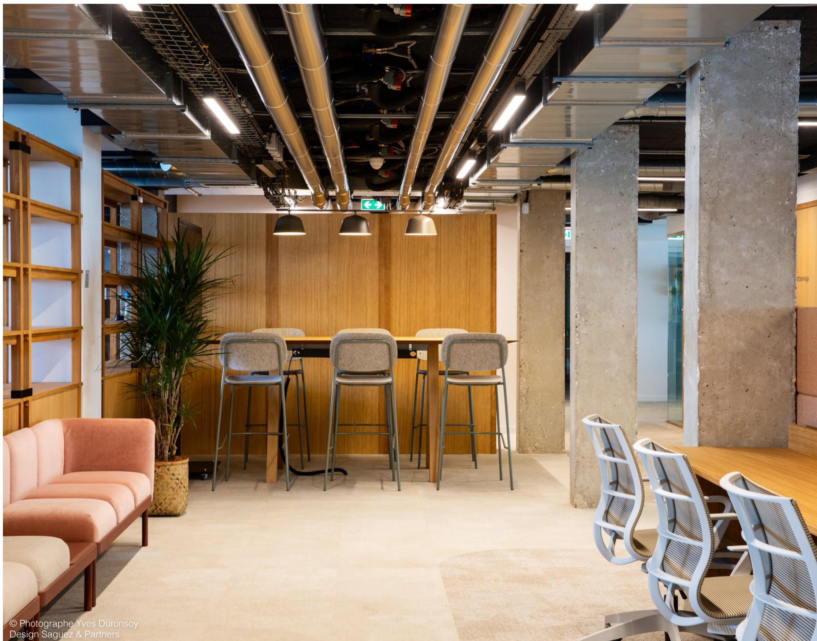
Design Saguez & Partners