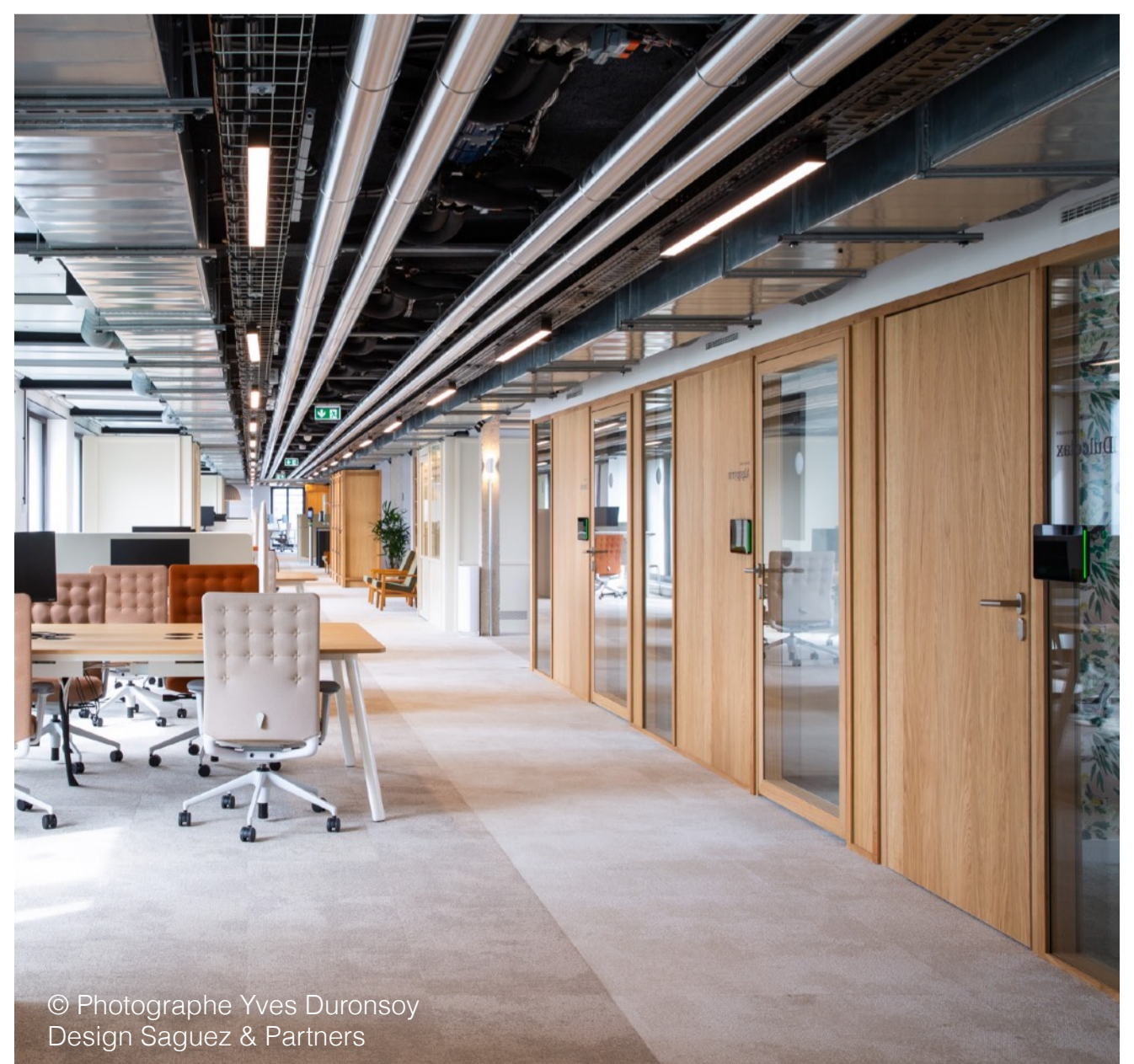
Design Saguez & Partners