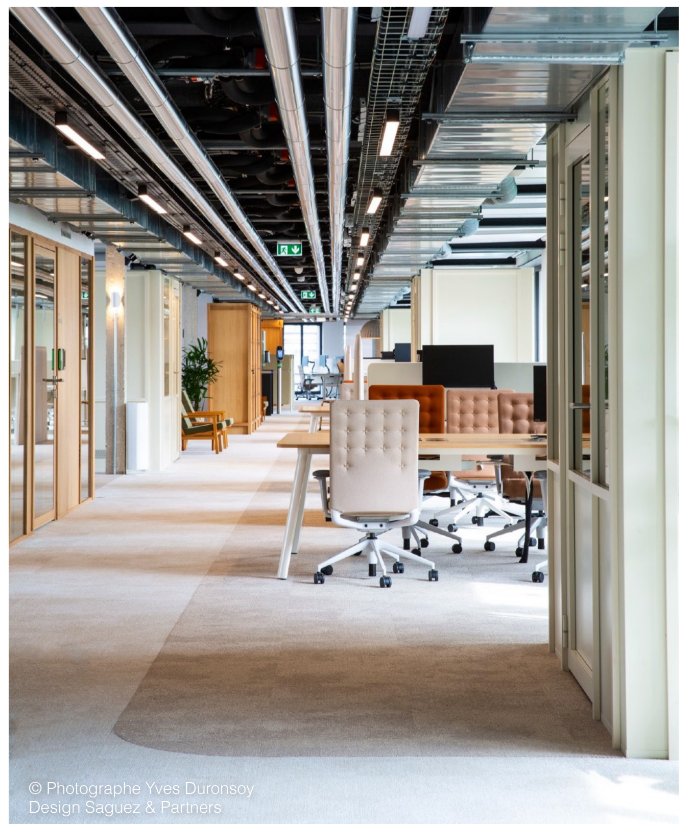
© Photographe Yves Duronsoy Design Saguez & Partners

Mais encore fallait-il passer de l'idée à l'action. Trouver le bon produit – au bon moment, et en bonne quantité – pouvait sembler complexe. Pourtant, ce qui aurait pu devenir un casse-tête logistique s'est transformé en une opération fluide et bien orchestrée, grâce à l'expertise d' ORAK , spécialiste du réemploi de sols, et à l'approche d' Interface , qui conçoit ses produits en pensant à l'ensemble de leur cycle de vie.