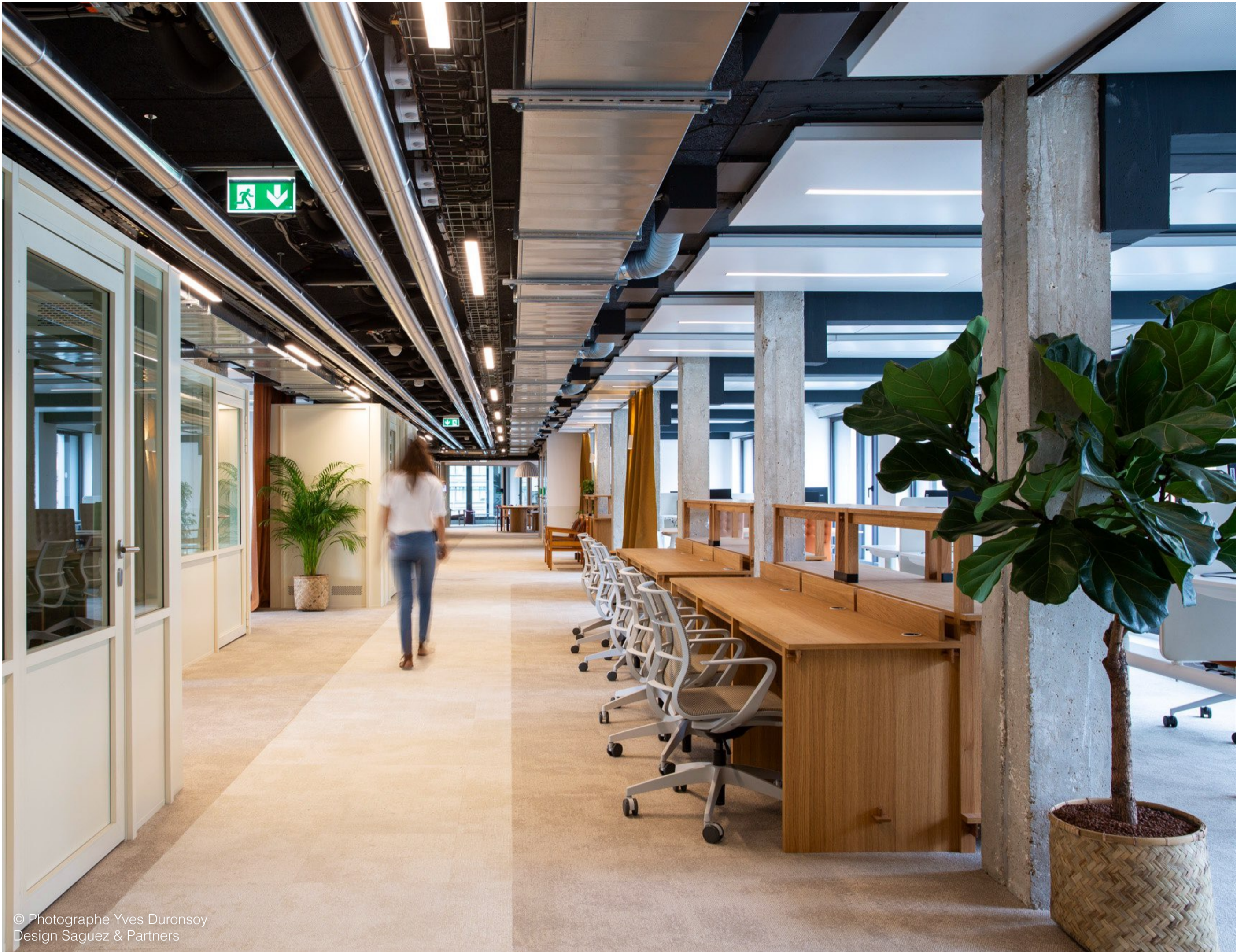
Design Saguez & Partners