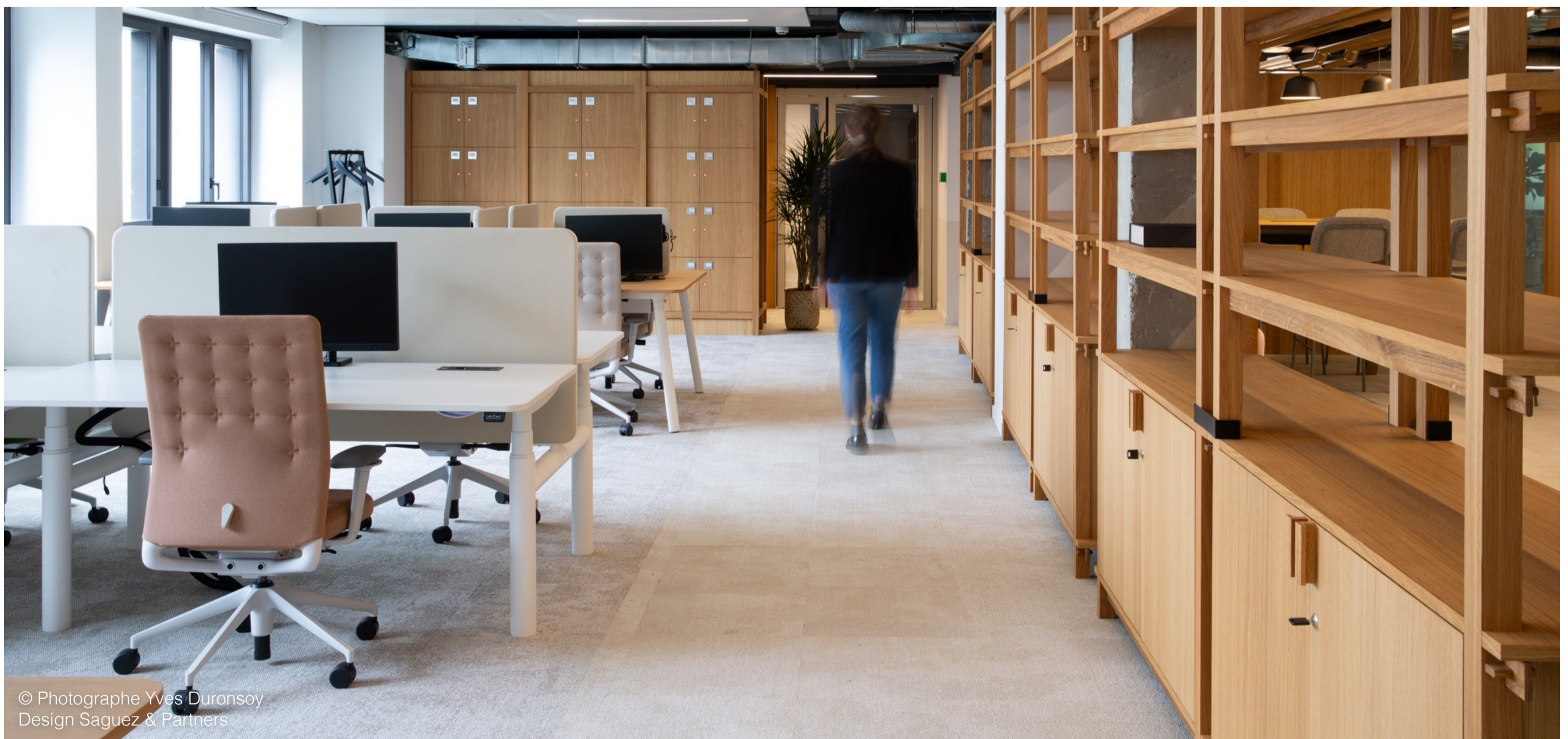
© Photographe Yves Duronsoy Design Saguez & Partners

Ces dalles ont ensuite été intégralement reconditionnées dans nos ateliers : triées, minutieusement contrôlées, nettoyées et stockées, elles ont été livrées prêtes à poser sur le site Sanofi – avec le même niveau d'exigence qu'un produit neuf.