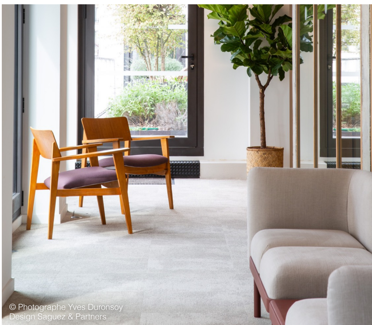
Design Saguez & Partners