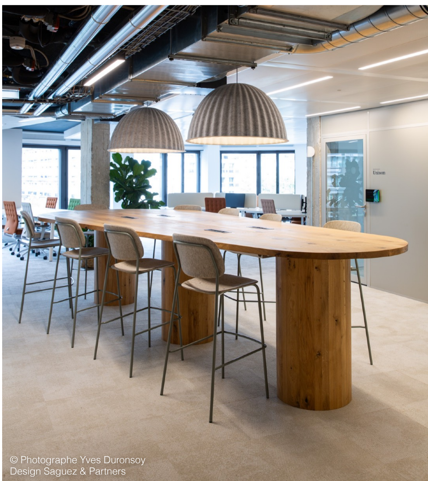
Design Saguez & Partners