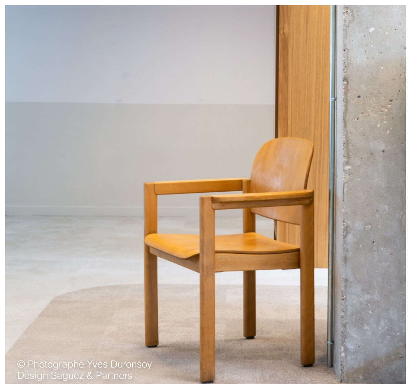
© Photographe Yves Duronsoy Design Saguez & Partners

par rapport à une dalle neuve selon la FDES du produit (maintenance incluse)